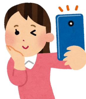
①インストール&アプリ起動