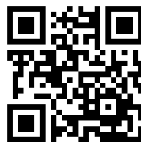
ダウンロード用QRコード