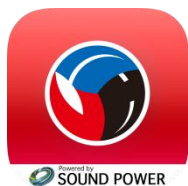
ARアプリのアイコン画像